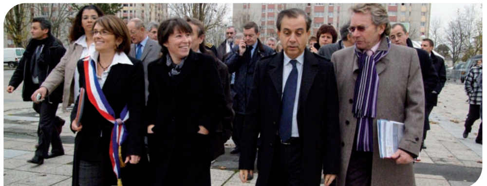
Visite du quartier avec Fadela Amara et Roger Karoutchi.

Mais aujourd'hui, le plus important reste à faire. Il faut construire ce nouveau quartier. Et les chiffres sont impressionnants. En moins de cinq ans, 211 logements vont être démolis – avec à partir de janvier 2009 la démolition de la Tour du 2 Cézanne – et 213 construits ou reconstruits. Dans le même temps, 821 logements seront réhabilités et 1 323 résidentialisés. Tout au long de ce programme qui s'achèvera en 2013, Val du Loing Habitat mise sur l'écoute et l'échange avec la population. Deux gages essentiels de réussite de cette ambitieuse opération. ●